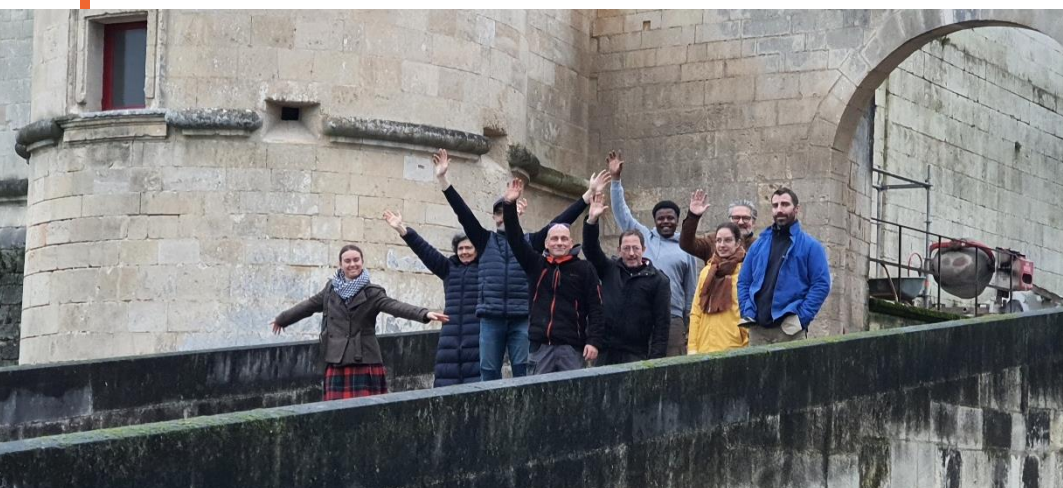
Les « Vie la joie »