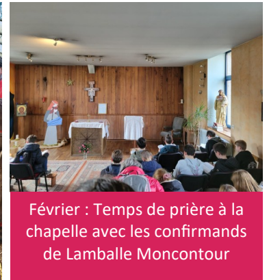
Février : Temps de prière à la chapelle avec les confirmands de Lamballe Moncontour