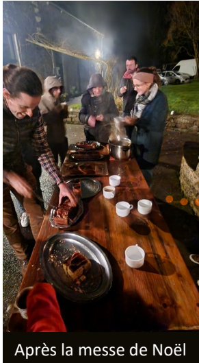
Après la messe de Noël