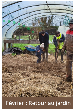
Février : Retour au jardin