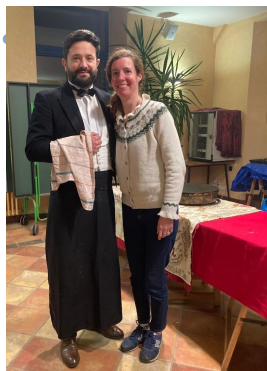
Mars : Les référents préparent le Mardi Gras !