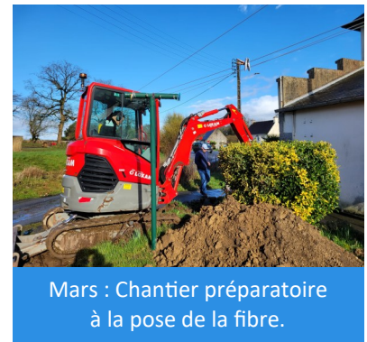
Mars : Chantier préparatoire à la pose de la fibre.