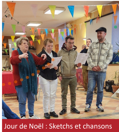
Jour de Noël : Sketchs et chansons