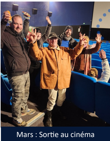
Mars : Sortie au cinéma